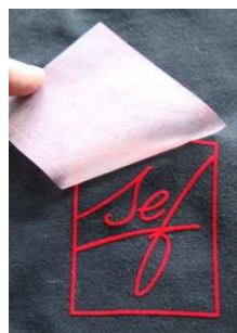
Trägerfolie abziehen, fertig!

VelCut Evo ist mit Viskoseflock in 22 Farben beflockt. Dieselben Farben sind auch in Transflock verfügbar, so dass sich große Auflagen an Flocktransfers, mit Transflock konventionell im Siebdruck hergestellt, perfekt mit Flocktransfers aus VelCut Evo kombinieren lassen. Für größere Auflagen steht auch die stanzfähige Variante DIE-CUT p-bac in den gleichen Farben zur Verfügung. VelCut Premium ist mit Polyamidflock in vier Fluorfarben erhältlich.